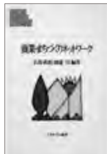
商業・まちづくりネットワーク (共編著、ミネルヴァ書房、2005年)