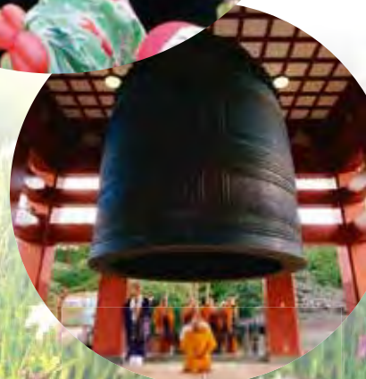
蓮華院誕生寺 奥之院