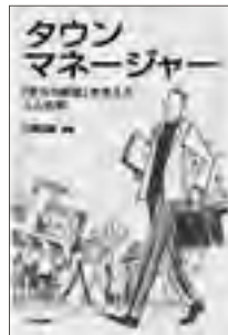
タウンマネージャー (編著、学芸出版社、2013年)

楽しくて ちょっと 厳しい 「読む辞典」 “空き店舗問題”から“ワンストップ・ショッピング”までわが 国の商業研究の泰斗が、商業やまちづくりのさまざまについて、 辛口の解説を展開。 思わず「なるほど!」「そうだったのか!!」と膝を打つこと間違 いなし。