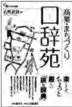
商業・まちづくり辞苑 (碩学舎、2012年)

楽しくて ちょっと 厳しい 「読む辞典」 “空き店舗問題”から“ワンストップ・ショッピング”までわが 国の商業研究の泰斗が、商業やまちづくりのさまざまについて、 辛口の解説を展開。 思わず「なるほど!」「そうだったのか!!」と膝を打つこと間違 いなし。