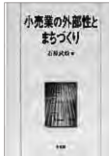
小売業の外部性とまちづくり (有斐閣、2006年)