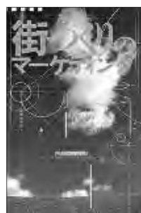
街づくりのマーケティング (共著、日本経済新聞スア、1992年)