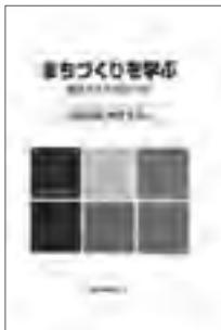
まちづくりを学ぶ (共編著、有斐閣、2010年)