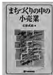
まちづくりの中の小売業 (有斐閣、2000年)